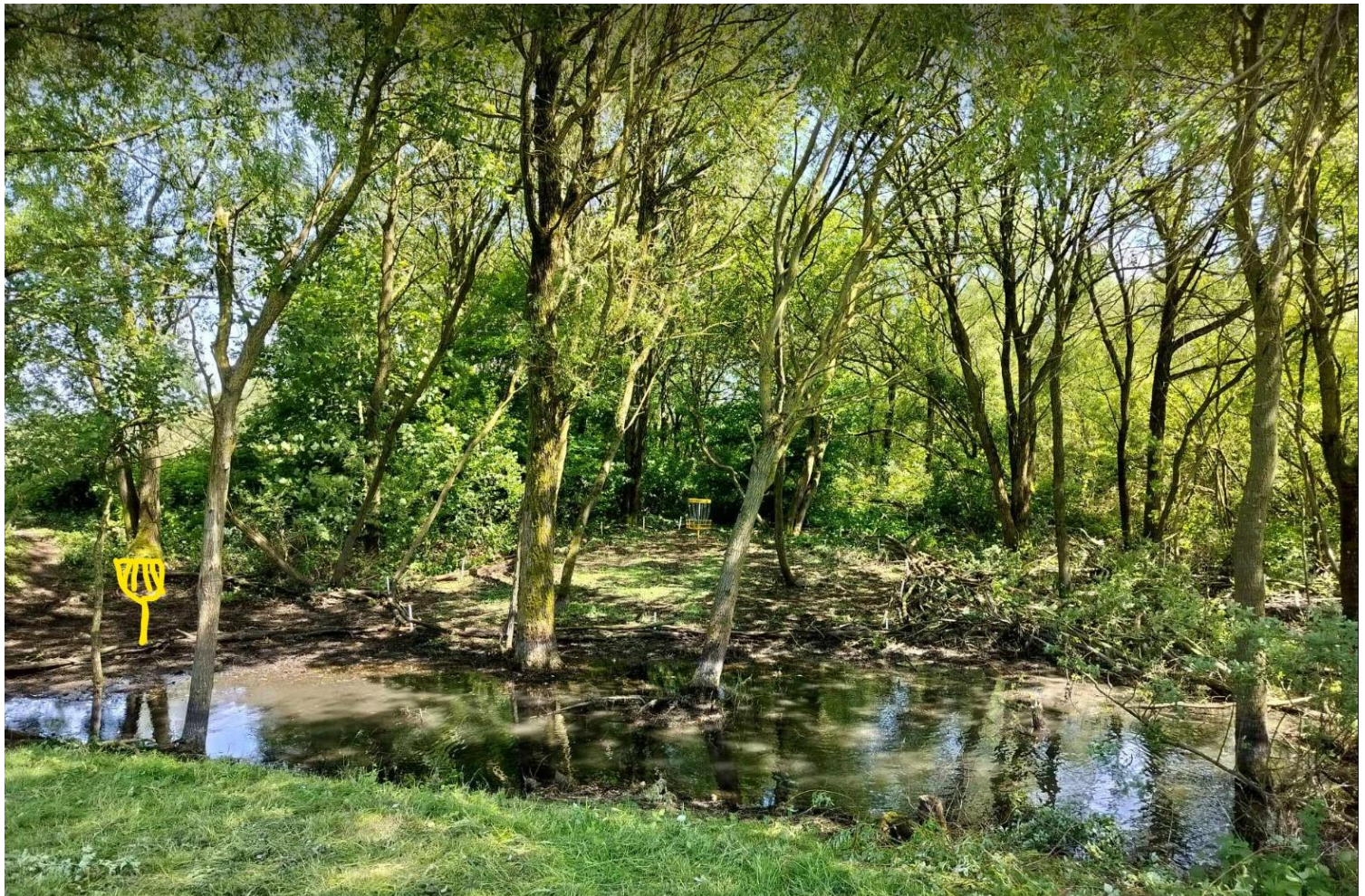
Tegnet kurv, er gammel placering.